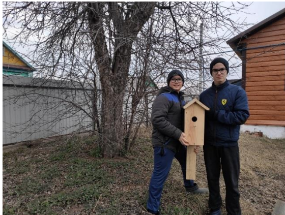
Наш «Зеленый уголок»